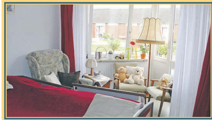
Jedes Zimmer ist etwas anders geschnitten. Dieses hat einen kleinen Erker

Die Baukosten betragen 4,5 Millionen Euro, hinzu kommen zirka 300.000 Euro für die Außenanlagen und rund 600.000 Euro