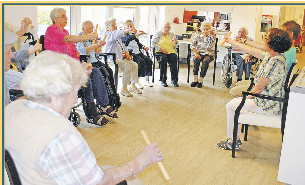
Bei der Stuhlgymnastik haben die Senioren viel Spaß