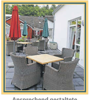
Ansprechend gestaltete Terrassen in den grünen Innenhöfen

für die Einrichtung. Ein Ziel des Umbaus war die Schaffung von insgesamt sieben Wohngruppen. Jede Wohngruppe umfasst zwischen zwölf und 19 Personen hat einen individuellen Schwerpunkt. So gibt es eine Wohngruppe für Bewohner mit schwerer Demenz, eine für geistig und körperlich