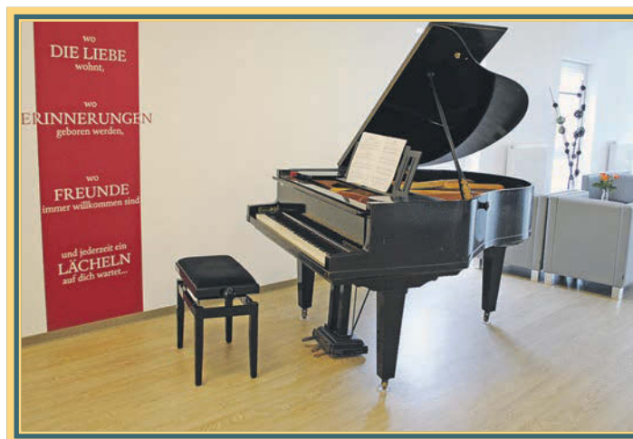
Im Foyer des Seniorenheims lädt ein echter Konzertflügel zu musikalischen Einlagen ein